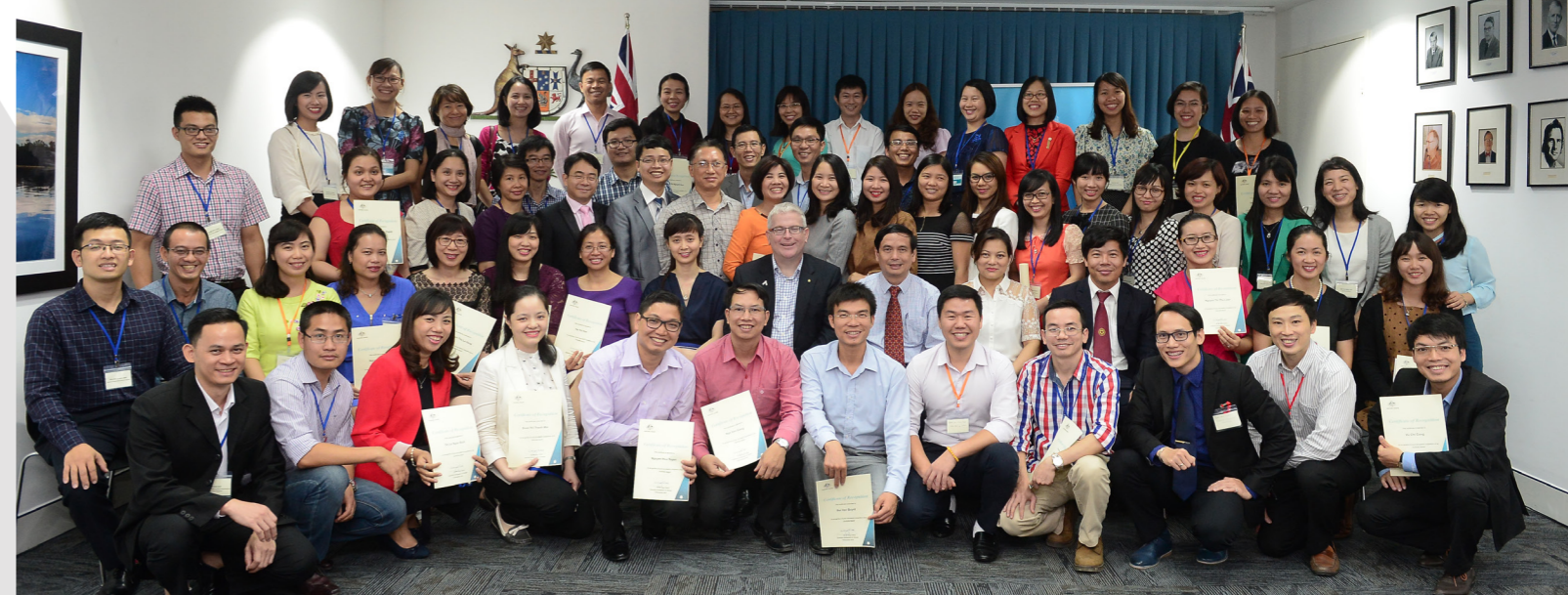
Đại sứ Australia tại Việt Nam, Ngài Craig Chittick, chụp ảnh tập thể cùng các cựu sinh viên Học bổng Chính phủ Australia và Học bổng Endeavour tại buổi tiệc tối và chào đón cựu sinh viên trở về tại Đại sứ quán Australia ở Hà Nội, ngày 18/11/2016.